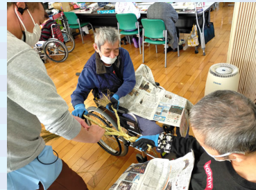
しめ縄づくり！ おかげさまで完売です！