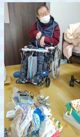
居室は職員・利用者の方と 整理整頓♪