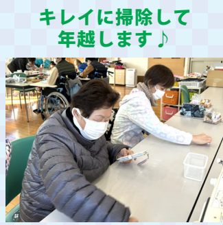
キレイに掃除して 年越します♪