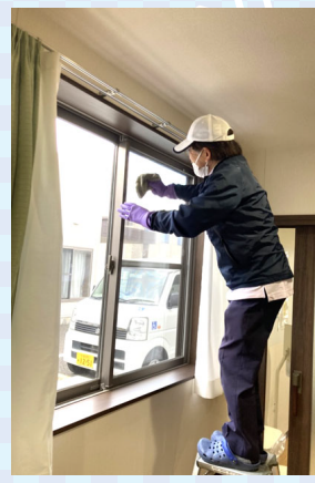
キッチン・窓・床・壁 ピカピカになりました☆