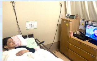
夜更かしして～ 紅白歌合戦♪ 年末特番見ました